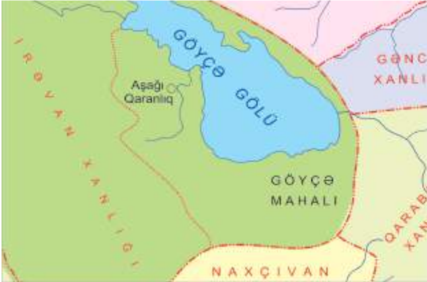
Şəkil 23. Göyçə mahalı

GÖYÇƏ MAHALI.* İrəvan xanlığının şimal-şərq hissəsində yerləşən ən böyük mahalı Göyçə idi. Bu mahal Göy-