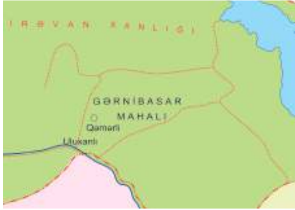
Şəkil 6. Gərnıbasar mahalı

GƏRNİBASAR MAHALI. Bəhs edilən dövrdə Gərnı-Vedıbasar mahalı birləşmiş mahal olub Azad çayından (Gərnıçay) suvarılan və Arazdan şimala tərəf olan torpaqları, həmçinin Vedıçay və Qapançay hövzəsindən suvarılan vadiləri əhatə edirdi. Şimaldan Göyçə, şərqdən Şərurla həmsərhəd idi. 1 Bu mahal da sonralar iki yerə – Gərnıbasar və Vedıbasar mahallarına bölünmüşdü. 2