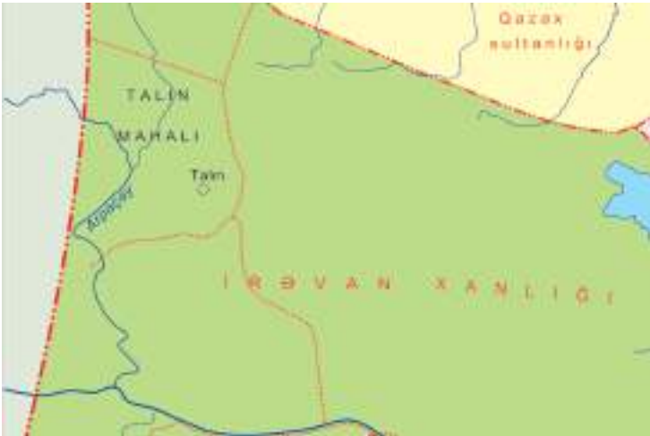
Şəkil 14. Talin mahalı

Səədli mahalına məxsus 14 kənd qeydə almış və bu kəndlərdən 5-nin artıq dağıldığını qeyd edir. 1 Məhz buna görə də, C.Bornoutyan əsasən Səədli tayfasının yaşadığı Səədli mahalının mərkəzi Xeyribəyli olmaqla 9 kəndi əhatə etdiyini qeyd edir. 2