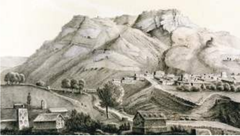
Şəkil 12. İrəvan xanlığının Rusiya tərəfindən işğalından sonra Gogb (Qogb) duz dağının və duz mədənlərinin görünüşü Dübua de Monperenin çəkdiyi şəkil (XIX əsr)

yararlı kənd qeydə alınmışdı. 1 Məşhur Göğb (Qulp) kəndi və eyni adlı duz mədəni burada yerləşirdi. Bu kənd artıq mahal mərkəzinə çevrilmişdi. 2