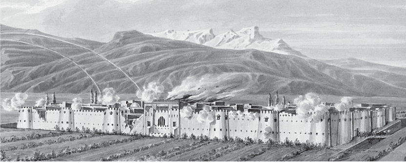
Şəkil 18. Sərdarabad mahalı