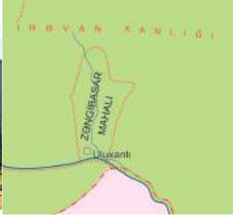
Şəkil 5. Zəngibasar mahalı