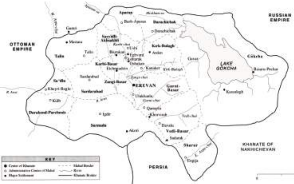
Xəritə 1. İrəvan xanlığının inzibati xəritəsi. 1820-ci il

çə gölü hövzəsindəki Azərbaycan torpaqlarınının əksər hissəsini əhatə edirdi. Mahal şimaldan Şəmşəddil sultanlığı, Gəncə xanlığı, şimal-qərbdən Dərəçiçək mahalı, qərbdən Qırxbulaq və Gərnibasar mahalları, cənub-qərbdən Vedibasars mahalı, cənubdan Naxçıvan xanlığı, şərqdən isə Qarabağ xanlığı ilə həmsərhəd idi. Ərazisinin böyük olmasına baxmayaraq, müharibə meydanı olduğu üçün əhalisi az idi. İ.Şopen Göyçə mahalına məxsus 126 kənd qeydə almış və bu kəndlərdən 67-nin artıq dağıldığını qeyd edir. Mahalın