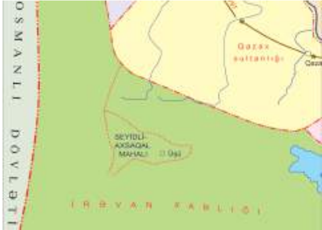
Şəkil 16. Seyidli-Axsaxlı mahalı