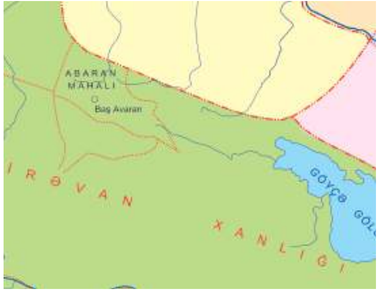
Şəkil 21. Abaran mahalı

ABARAN MAHALI.* İrəvan xanlığının şimal qurtaracağına yerləşən Abaran mahalına böyük Alagöz dağlarından şimala və şimal-şərqə doğru uzanan torpaqlar, Alagöz və Pəmbək dağları arasındakı ərazilər daxil idi. Mahal yüksəklikdə yerləşən torpaqları əhatə edərək Abaran-su çayının sahilində yerləşirdi. Abaran mahalı şimaldan Pəmbək, Şimal-qərbdən Şörəyel, cənubdan Seyidli-Axsaxlı, şərqdən isə Dərəçiçək mahalları ilə həmsərhəd idi. İ.Şopen Abaran ma-