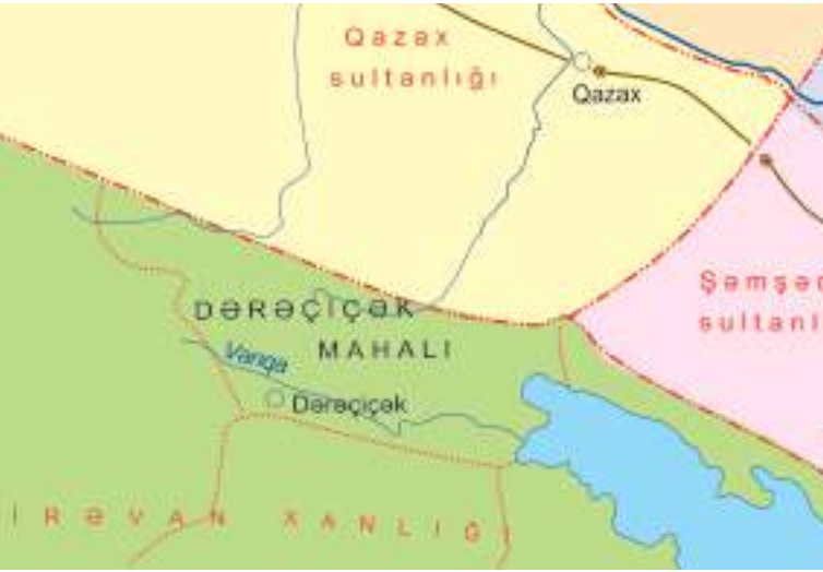
Şəkil 22. Dərəçiçək mahalı

Alapars kəndinə qədər uzanan dərədən ibarət idi. Dərəçiçək mahalı şimaldan Pəmbək, qərbdən Abaran, cənubdan Qırxbulaq, şərqdən Göyçə gölünün qərbində yerləşən torpaqlarla həmsərhəd idi. İ.Şopen burada