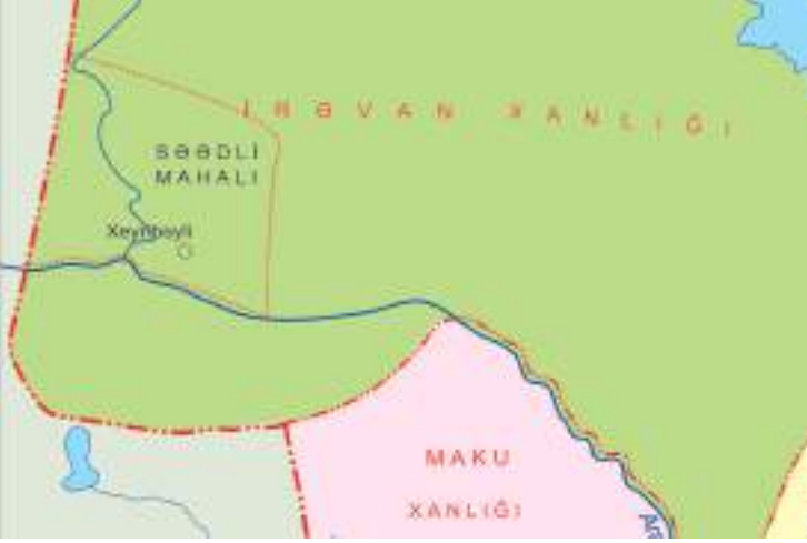
Şəkil 18. Səədli mahalı