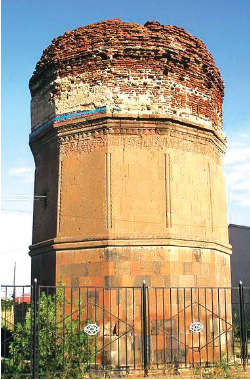
Şəkil 4. Cafarabad kəndindəki Ömir Səad məqbarəsi

İ.Şopen Zəngibasar mahalına məxsus 33 kənd qeyd almışdır və bu kəndlərdən 7-sinin artıq dağıldığını qeyd edir. 1 Məhz buna görə C.Bornoutyan Zəngibasar mahalına mərkəzi Uluxanlı olmaqla 26 kəndin daxil olduğunu yazır. 2