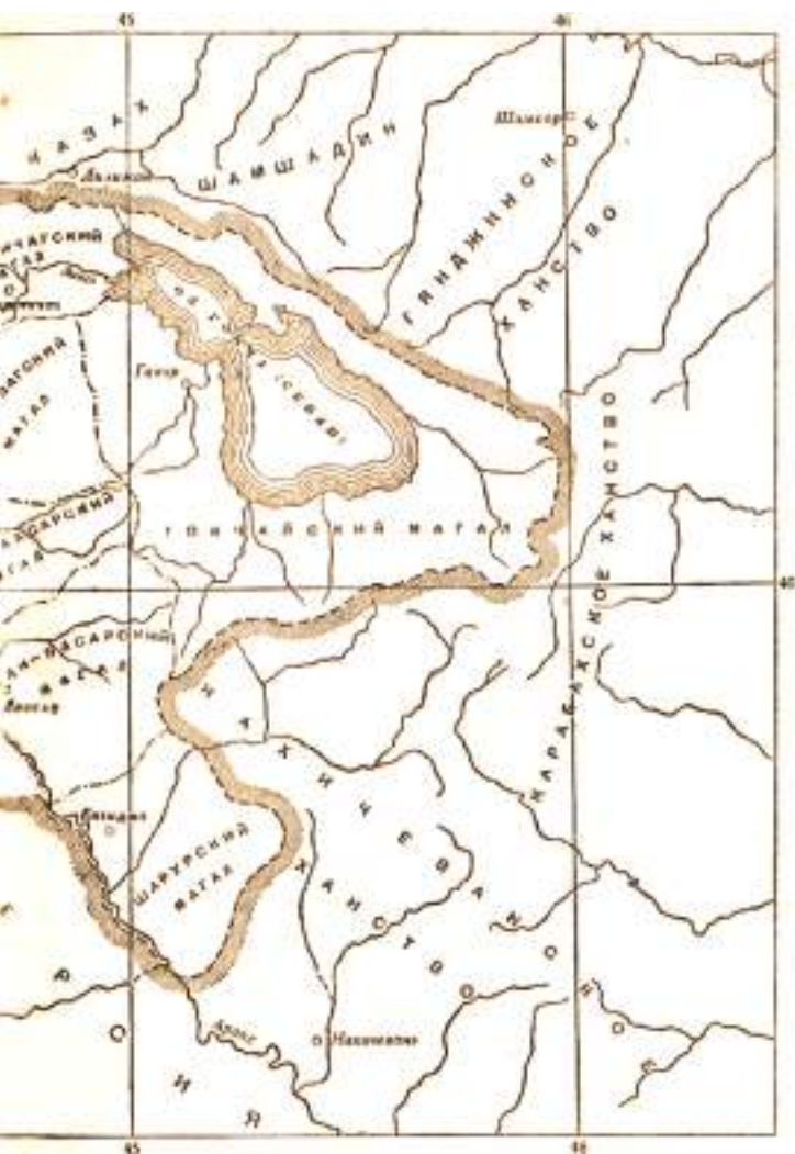
Мәnbә: Григорян З.Т. Присоединение Восточной Армении к России в начале XIX в. Москва, 1959, с.143