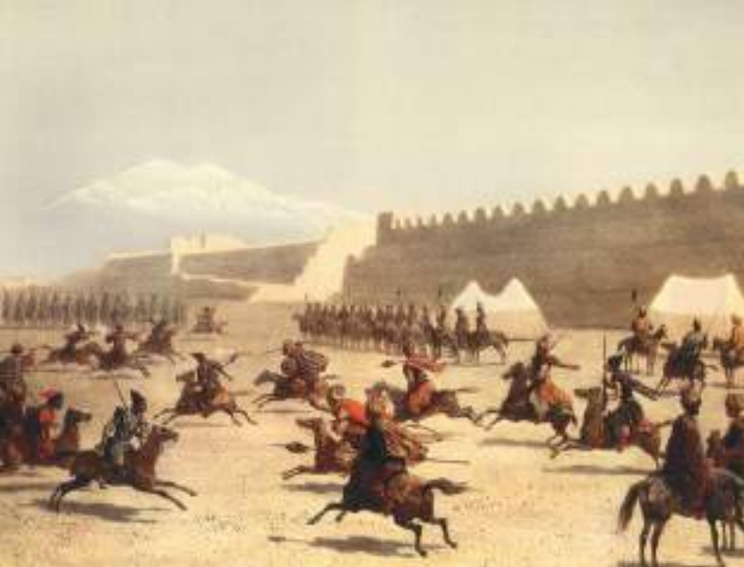
Şəkil 19. Sərdarabad qalası uğrunda döyüş səhnəsi