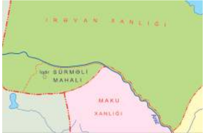
Şəkil 10. Sürməli mahalı

SÜRMƏLİ MAHALI. İrəvan xanlığının cənub-qərb ərazilərini əhatə edən bu mahal Araz çayının sağ sahilində yerləşirdi. Mahal şimal və şimal-şərqdən Araz çayı ilə, qərbdən Dərəkənd-Parçenis mahalı, cənubdan onu Bayəzid paşalığından ayıran Ağrıdağ silsiləsi