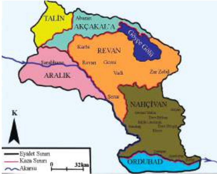
Şəkil 1. 1590-cı il "Müfəssəl dəftər" gərə Çuxursəd əyalətinin inzibati bölgüsü

1590-cı ilin payızında (19-29 Məhərrəm 999 // 17-27 noyabr 1590) Osmanlı dövlət məmurları tərəfindən tərtib edilmiş İrəvan əyalətinin Müfəssəl dəftərinə görə həmin dövrdə Çuxursəd bölgəsi Talın, Abaran (Ağcaqala), Aralıq (Şərabxana) İrəvan, Naxçıvan və Ordubad əyalətlərini əhatə etmişdir. 1