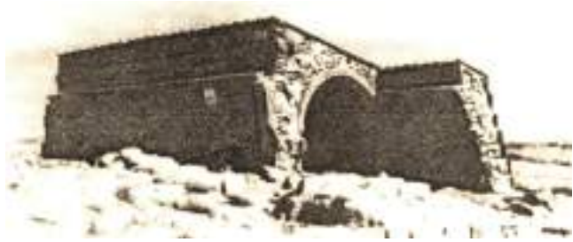
Şəkil 15. Azərbaycan türklərinə məxsus Talın karvansarası

SEYİDLİ-AXSAXLI MAHALI. İki tayfanın adından götürülmüş mahal Talın mahalı sərhədlərindən baş-