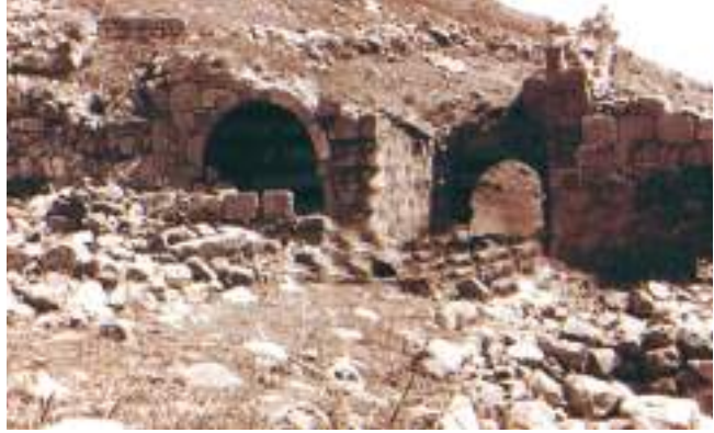
Şəkil 9. Əxi Təvəkkül zaviyəsinin xarabalıqlarının görünüşü (XII əsr).

Arpaçay vasitəsilə iki yerə bölünürdü. 1 İ.Şopenin siyahıya almasında 61 kənddən ibarət olan bu mahalın 11 kəndi tamamilə dağıdılmışdı. 2 C.Bornoutyana görə mərkəzi Əngiçə olan bu mahal 50 kəndə nəzarət edə bilirdi. Arpaçay mahalın bütün suvarma sistemini təmin edirdi. 3