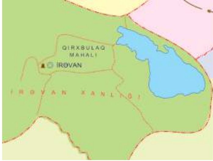
Şəkil 3. Qırxbulaq mahalı

maldan Dərəçiçək, qərbdən Gərnibasar, şərqdən Gərnivedibasar mahalları ilə həmsərhəd idi. XVIII əsrin sonunda bu mahal ayrı-ayrılıqda Qırxbulaq və Zəngibasar mahalları kimi verilir. İrəvan xanı Məhəmməd Hüseyin xan Qacara (1785-1804) məxsus olan müklərin