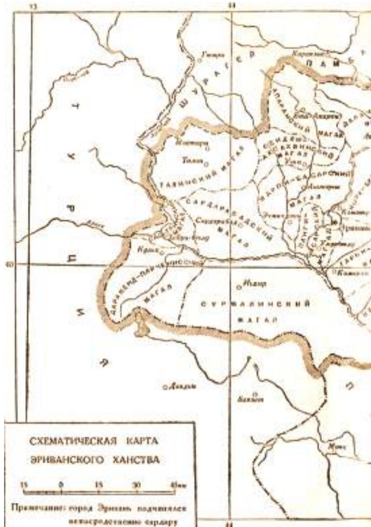
Xəritə.2. İrəvan xanlığının sxem-xəritəsi