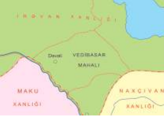
Şəkil 7. Vedibasars mahalı

sar mahalına məxsus 54 kəndi qeyd almış və bu kəndlərdən 33-nün artıq dağıldığını qeyd edir. 2 Məhz buna görə də,