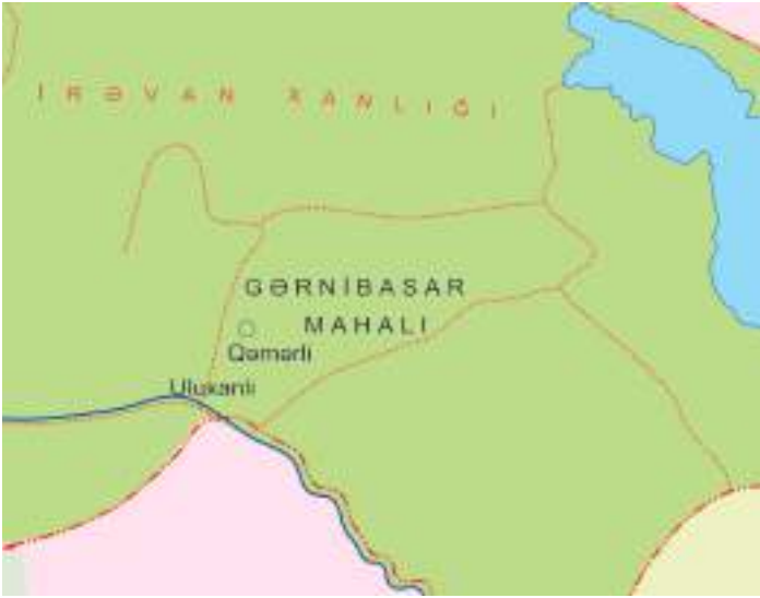
Şəkil 20. Qərbibasar (Körpübasar) mahalı

mahalı ilə həmsərhəd idi. Gərnı çayı ilə suvarılan bütün torpaqlar bu mahalla daxil idi. Qərbi mahalda 49 kənd qeydə alınmışdır. Bu kəndlərdən 9-uda dağıdılmışdı. 3 Abaran-su, Qərbi çayı və Araz çaylarının qolu mərkəzi Əştərək olan Qərbibasar mahalını su ilə təmin edirdi. C.Bornoutyana gö-