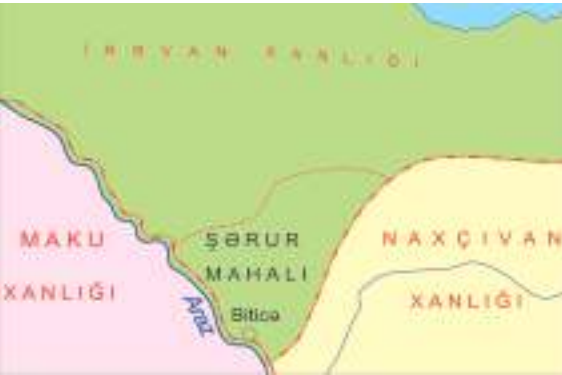
Şəkil 8. Şərur mahalı

sar mahalına məxsus 54 kəndi qeyd almış və bu kəndlərdən 33-nün artıq dağıldığını qeyd edir. 2 Məhz buna görə də,