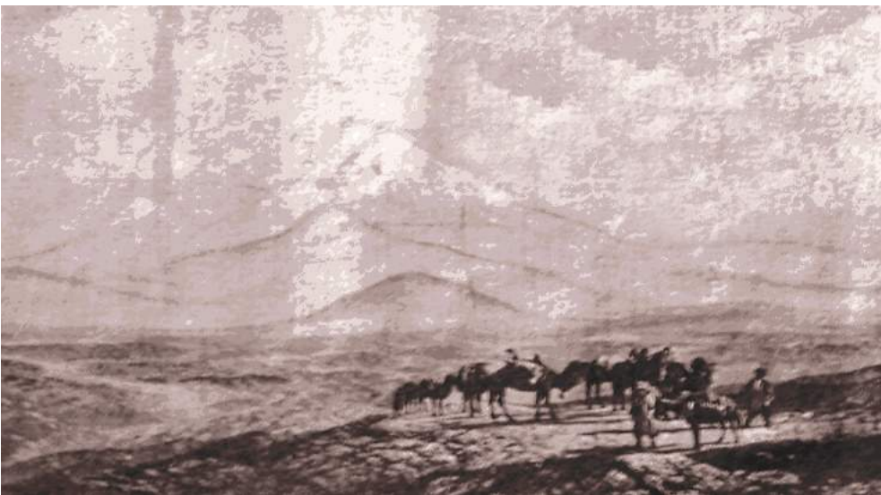
Şəkil 1. Ağrıdağ

V.Jelixovskaya Göyçə gölünün şimal-şərq sahilində demək olar ki, oturaq əhalinin olmadığını, burada öz mal-qaraları ilə birlikdə tərəkəmə tatarlarının yaşadığını, İran sərhəddindən isə qaraçı və kürdlərin buraya gəldiklərini yazırdı. O, İrəvanı görünüşünə görə tamamilə tatar (Azərbaycan – İ.M.) şəhəri adlandırırdı 2 .