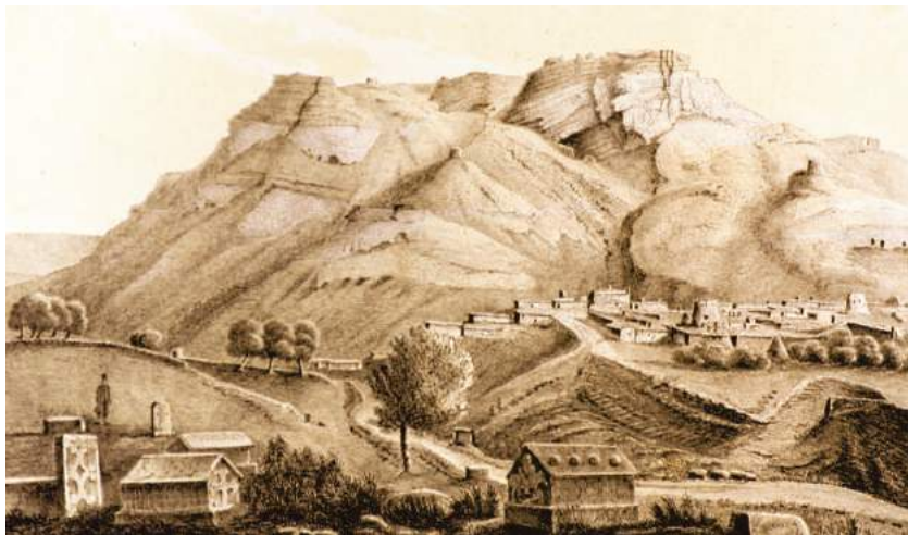
Şəkil 5. İrəvan xanlığının Rusiya tərəfindən işğalından sonra Göğb (Qoğb) duz dağının və duz mədənlərinin görünüşü

İrəvan xanlığında əhali toxuculuq və dulusçuluq ilə də məşğul olurdu. Lori, Pəmbək, Gümrü, eləcə də Zəngəzurun dağlıq hissəsinin qoyunçuluqla məşğul olan əhalisi, əsasən, xalçaçılıqla məşğul olur, qış aylarında özləri üçün corab, kətan parça toxuyurdular. Xanlıqda dulusçuluq məmulatı yerli xammala əsaslanırdı. İrəvan yaxınlığındakı Çölməkçi kəndində dulusçuluq (o cümlədən çölmək istehsalı) əsas məşğuliyyət sahəsi idi. İrəvan xanlığında sənaye istehsalı da inkişafa başlamışdı. Ölkədə İrəvan şəhəri yaxınlığında yerləşən Göğb (Qoğb)duz mədəninə bir neçə emalatxanadan başqa hələlik digər sənaye müəssisəsi yox idi 1 .