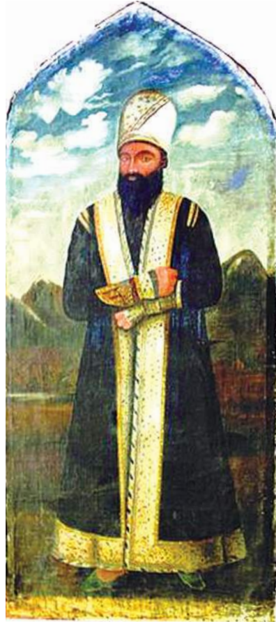
Şəkil 7. İrəvan xanı Hüseynqulu xan Qacar (1806-1827)

Sonuncu İrəvan xanı Hüseynqulu xan başqa xanlıqlardan olan qaçqın kəndliləri öz torpaqlarında məskunlaşdırmağa şərait yaradır, onlara əkin istehsal alətləri və qoşqu heyvanları verməklə müəyyən