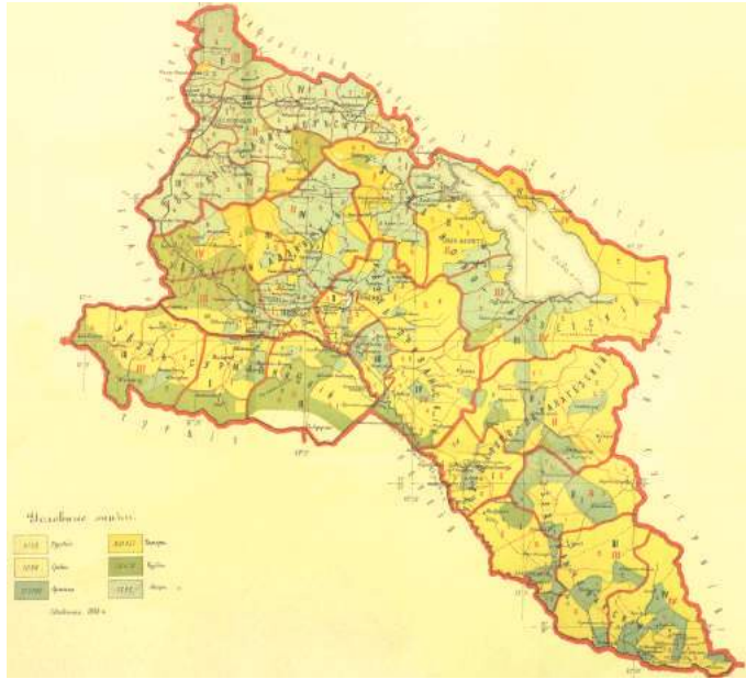
Xəritə 1. İrəvan quberniyasının etnik xəritəsi; xəritə 1902-ci ildə 1886-cı ilə aid kameral sayımının nəticələri əsasında tərtib edilib.

Sosial tərkibinə görə İrəvan xanlığının əhalisi imtiyazlı ali təbəqə (xan, bəylər, sultanlar, məliklər