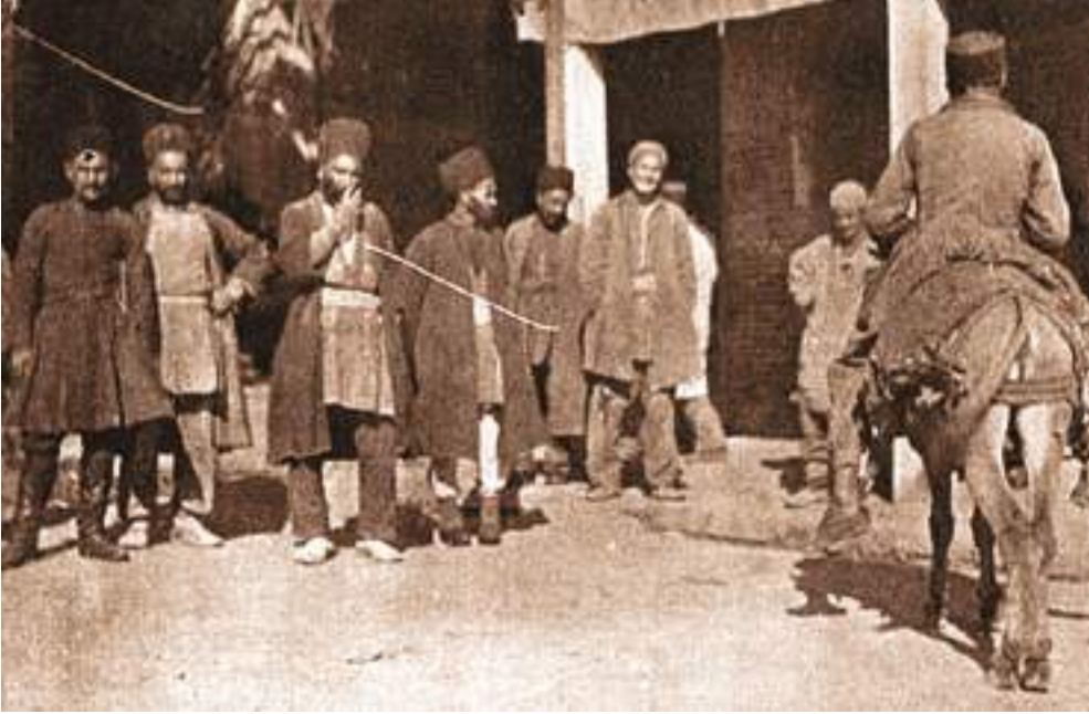
Şəkil 6. Köhnə İrəvan bazarı. 1905-ci ilə aid foto

Sərdarabad qalasında əhali əkinçilik, maldarlıq, kiçik ticarət, bez toxuculuğu, dəmirçilik, dərzilik və digər sənət sahələri ilə məşğul olurdular 1 . İrəvan əyalətində əhalinin əsasən qırmızı boya (qırmız) və duz istehsalı, həmçinin taxılçılıq, bağçılıq və şərabçılıqla məşğul olurdu. Ticarət İrəvan xanının əlində idi və əsasən, pambıq, düyü, buğda, arpa və duzdan ibarət idi 2 .