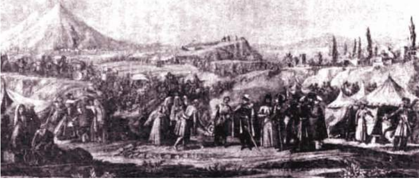
Şəkil 4. Ermənilərin İrandan Şimali Azərbaycan torpaqlarına köçürülməsi. 1828-ci il.

Əgər 1826-cı ildə İrəvan xanlığında tatarlar (Azərbaycan türkü – İ.M.) 76%, erməni 24% 1 olmuşdusa, artıq 1828 – 1829-cu illərdə ermənilərin Qacarlar İranı və Osmanlı dövlətindən İrəvan əyalətinə köçürülməsindən sonra burada müsəlmanlar (Azərbaycan türkləri – İ.M.) 43.2%, kürdlər 0.3%, yerli ermənilər (bu ermənilər I və II Rusiya – İran müharibələri zamanı buraya köçürülmüşdülər – İ.M.) 17.4%, Qacarlar İrandan köçürülən ermənilər 20,4% və Türkiyədən köçürülən ermənilər 18,7% təşkil etmişdir 2 . Yəni iki il ərzində köçürmələrdən sonra Azərbaycan türkləri 76%-dən 43,2-ə düşmüş, ermənilərin sayı isə 24%-dən 56,5% qalxmışdı.