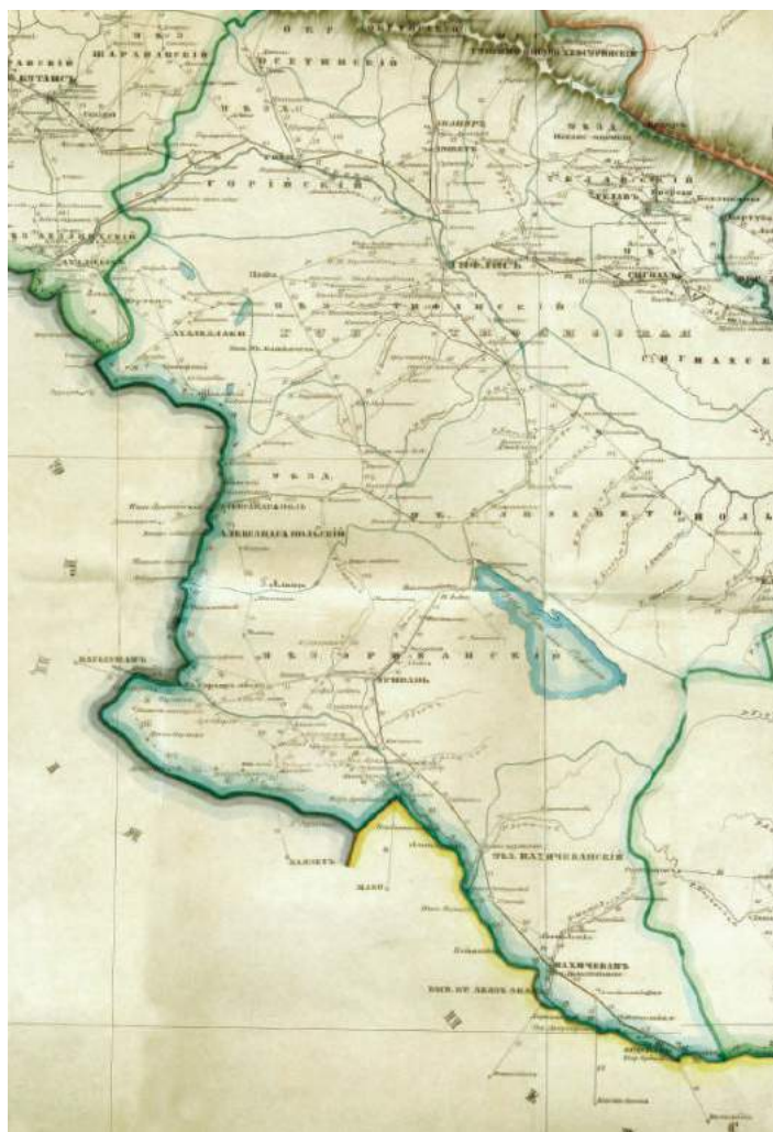
Xəritə 2. İşğal olunmuş Cənubi Qafqazın yol xəritəsində keçmiş İrəvan xanlığı