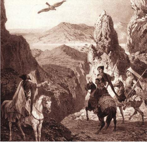
Şəkil 2. İrəvan xanı ovda

İrəvan şəhərində 85 hacı, 158 məşhədi, 105 kərbəlayı, mahallarda 25 hacı, 77 məşhədi, 239 kərbəlayı, elatlar arasında 6 hacı, 7 məşhədi, 4 kərbəlayı, ümumilikdə İrəvan əyalətində 111 hacı, 242 məşhədi və 348 kərbəlayı vardı. İrəvan xanlığında torpaq sahələri bəhrəkər, yarıkər, rəncbər və muzzla verildiyi üçün kəndlilər də eyni adla adlanırdılar 2 .