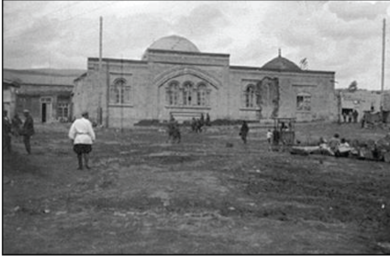
XX. yüzyılın başlarında yok edilen Demirbulag Camii