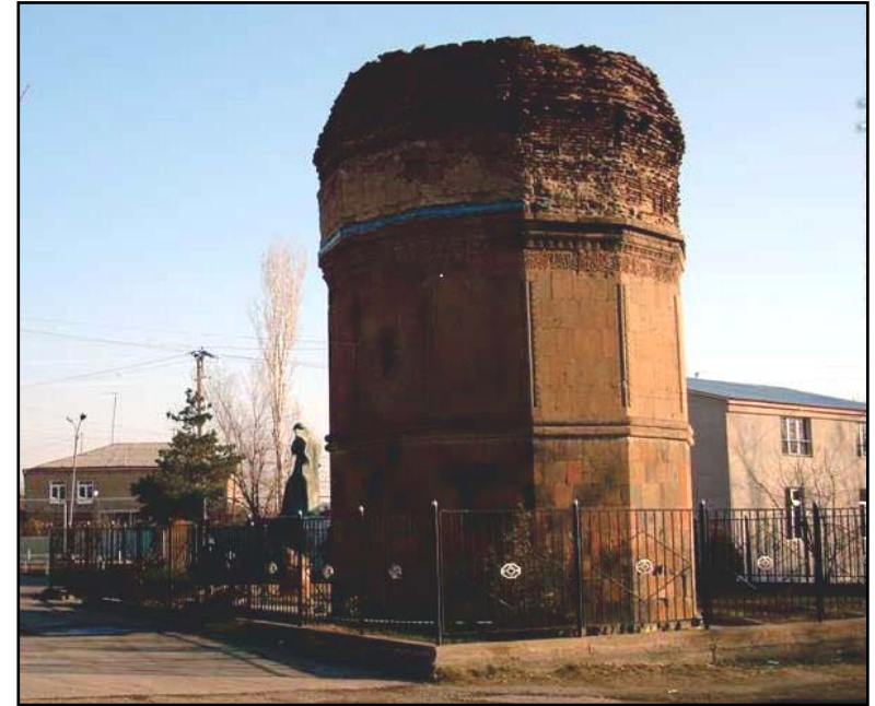
Emir Seed türbesi. Ceferabad köyü.