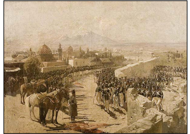
Rus ordusunun İrevan kalesine girmesi. 1827. Ressam F. Rubo