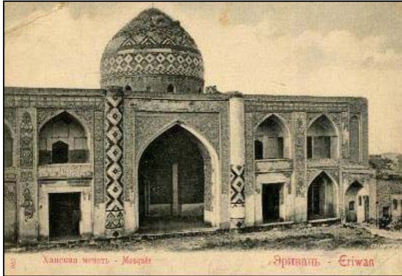
Serdar Camii. Kart postalda. XX. yüzyıl başı.