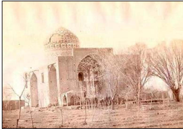
Yıkıma uğramış Şah Abbas Camii