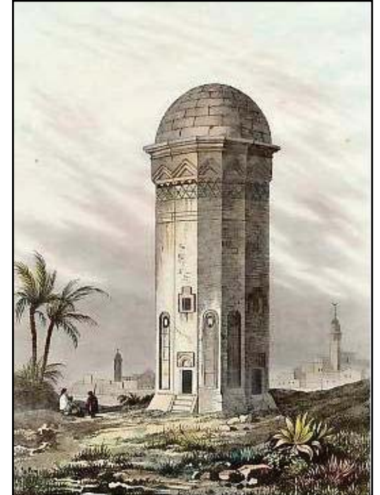
İrevan`da türbe. Ressam Vanderburx Gravürcü Devilliers. 1838.