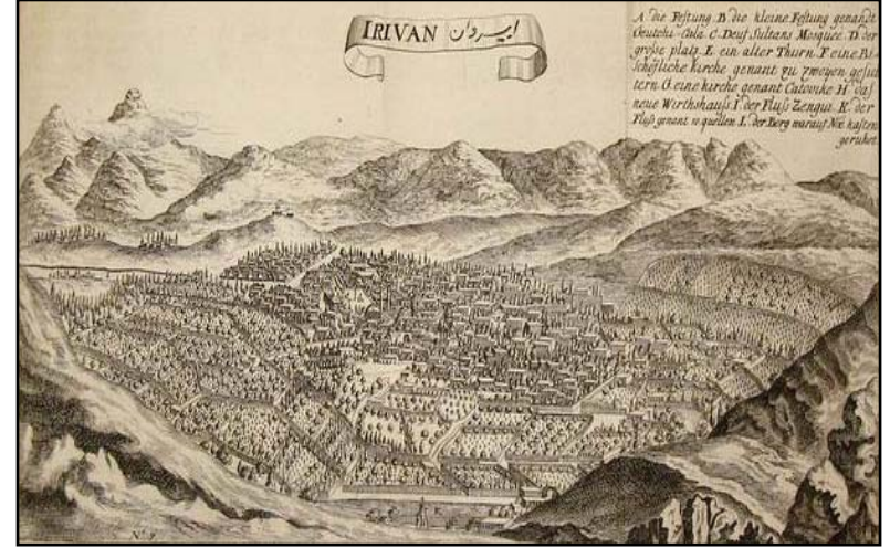
İrevan şehri. Ressam J. Şarden. 1673.