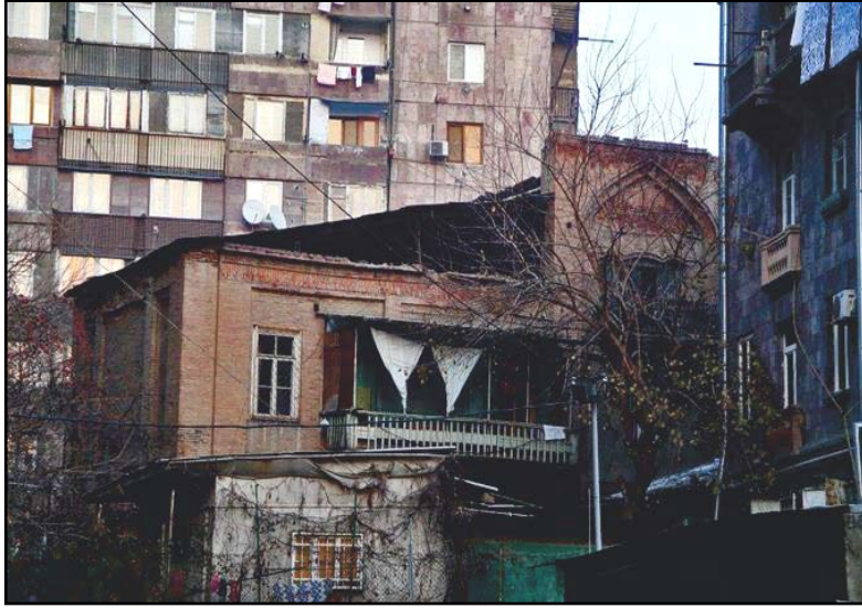
İrevan`da Ermeni ailenin yaşadığı tarihi medrese