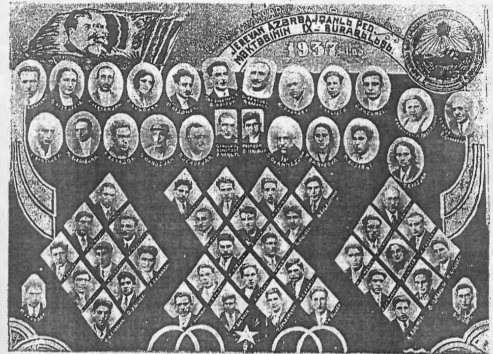
İrəvan Azərbaycanlı Pedaqoji Məktəbinin 9-cu buraxılışı, 1937-ci il.

Pedaqoji Texnikumu 1934-cü ildə Ümumittifaq texnikumlar yarışında birinciliyi qazanaraq 7000 manat məbləğində mükafata layiq görülmüşdür. 1935-ci ildə M.S.Ordubadı, M.Müşfiq, M.Hüseyn və başqalarından ibarət nümayəndə heyətinin İrəvana səfəri zamanı pedaqoji texnikumun müəllim və tələbə kollektivi ilə görüş keçirmişlər.