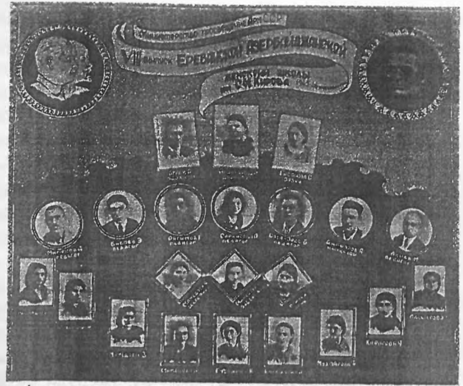
İrəvan Azərbaycanlı Qızlar Məktəbinin 8-ci buraxılışı.

1920-ci il noyabrın 29-da Ermənistanda Sovet hakimiyyəti qurulduqdan sonra məktəb və maarif probleminə münasibət dəyişir. Ermənistan inqilab komitəsi 6 dekabr 1920-ci ildə bütün məktəblərin dövlət ixtiyarına keçməsi, təhsilin ana dillində aparılması haqqında dekret imzalayır. Bundan sonra köhnə tipli məktəblər ləğv olunaraq, məzmunca yeni tipli təhsil ocaqları təşkil edilməyə başlandı. «1921-ci ilin aprelində Ermənistan Xalq Maarif Komissarlığının bütün bölgələrə göndərilən məktublarında qeyd olunurdu ki, tərbiyə işləri yenidən qurulmalı, köhnə tipli məktəblər ləğv olunmalı, yeni sovet məktəbi fəaliyyətə başlamalıdır» (8,6). Azərbaycan məktəblərinin yeni məzmununda təşkili istiqamətində ilk addımları atılaraq, birillik, ikiillik və xüsusi məktəblər ləğv edildi. Yeni tipli yeddiillik, səkkizillik və tam orta məktəblər təşkil olunaraq fəaliyyətə başladı. Dövrün tələbinə görə Azərbaycanda olduğu kimi, İrəvanda da məktəbləri iki qrupa bölmüşdülər. I dərəcəli - beş illik ibtidai məktəb (8-13 yaşında); II dərəcəli - beş illik orta məktəb (13-17 yaşında). Belə məktəblərə «Vahid əmək məktəbləri» deyirdilər.