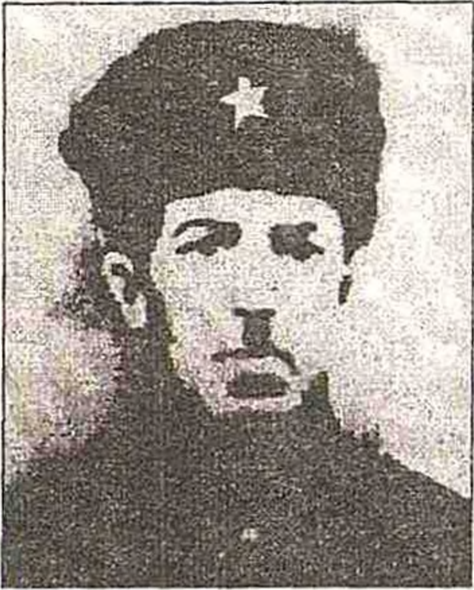
Abbasqulu bəy Şadlinski

Abbasqulu bəy Xanbaba oğlu Şadlinskinin adı xalqımızın mərd oğulları sırasında böyük hörmətlə çəkilir.