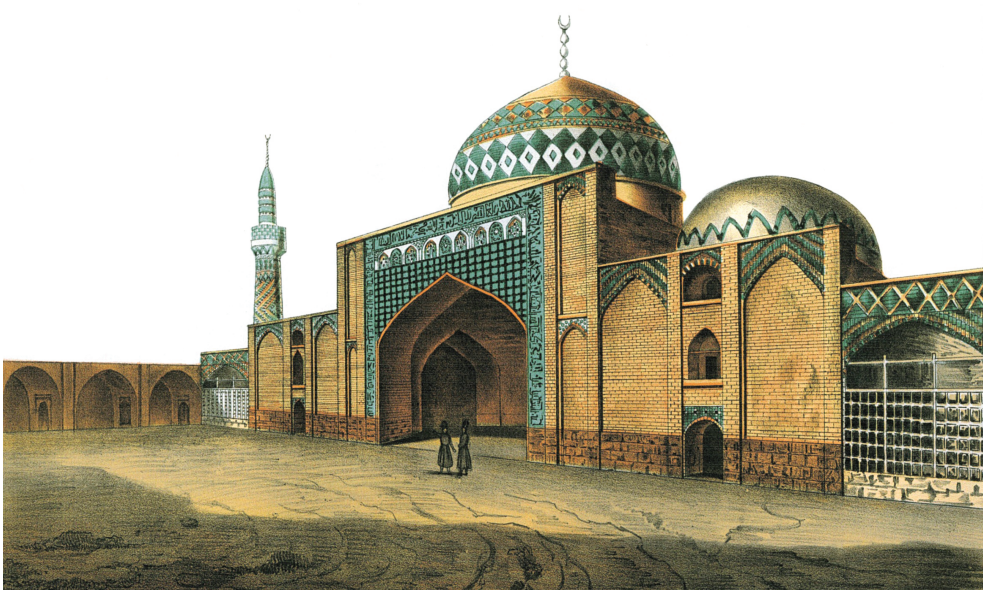
Древняя мечеть азербайджанских тюрок. Находилась внутри Иреванской крепости. Картина Дюбуа де Монпере (XIX век)

основную часть дворца, были включены в дворцовый комплекс в 1791 году сыном Гусейнали хана Мухаммед ханом Гаджаром. Таким образом, здание получило архитектурное завершение в виде монументального дворцового комплекса. 35 Ханский (или Сардарский) дворец в Иреване – некогда жемчужина восточного архитектурного искусства – был до основания разрушен армянами в 1918 году.