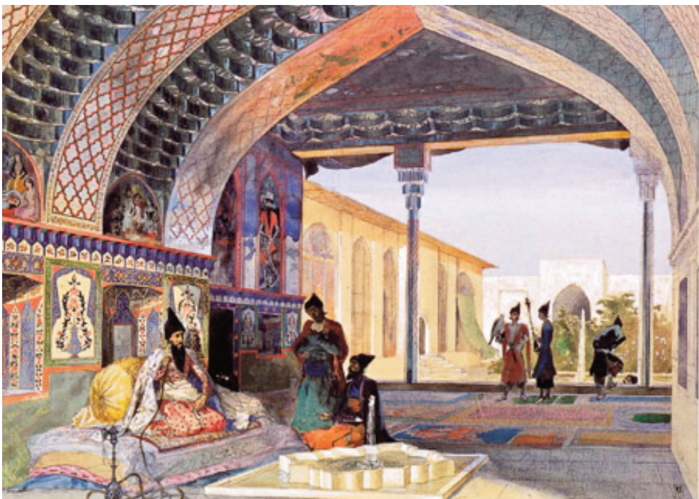
Приемная комната Ханского дворца. Художник Григорий Гагарин.

подавления возникших среди афшаров волнений, после чего он на протяжении пяти лет управлял Хорасаном. 58 Фатали шах дал новому иреванскому правителю Гусейнгулу хану титул «сардара» – командующего всеми военными силами на