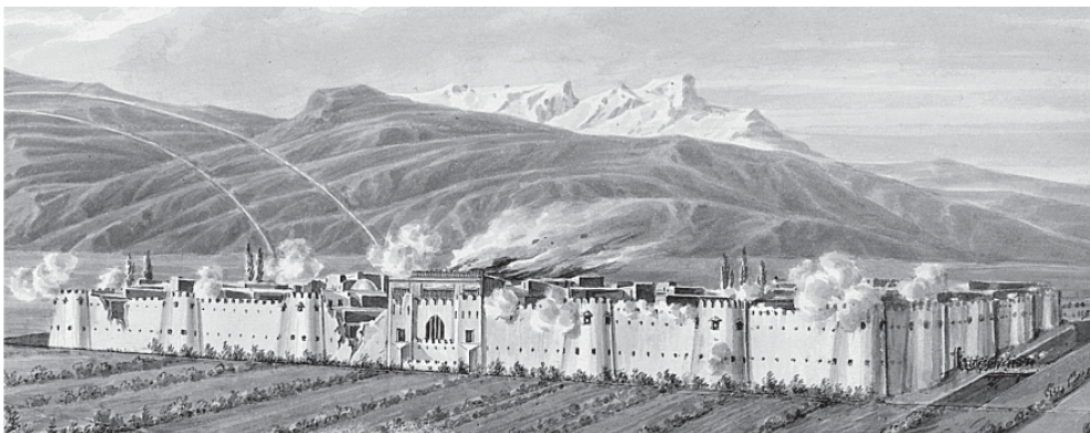
Общий вид Сардарабадской крепости.