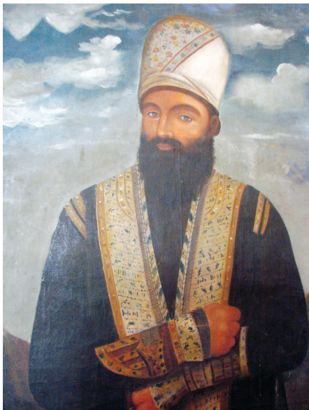
Иреванский хан Гусейнгулу хан Гаджар (1806-1827)

Это величественное сооружение также было стерто с лица земли армянскими вандалами.