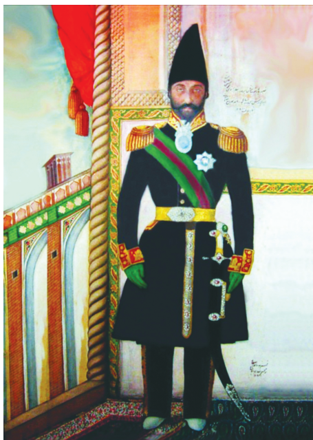
Брат иреванского хана Гусейнгулу хана Гаджара Гасан хан Гаджар