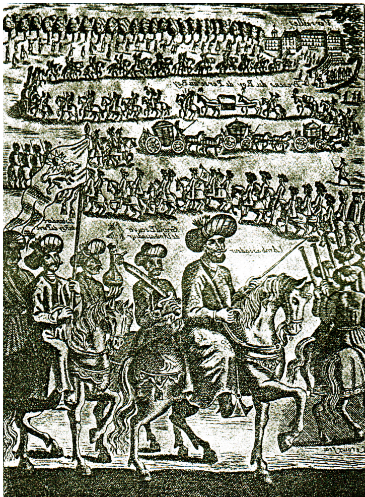
Посольская делегация во главе с иреванским правителем Мухаммед Рза беком в Париже. 1714 год. Картина французского художника XVIII века Лерокса Франса.